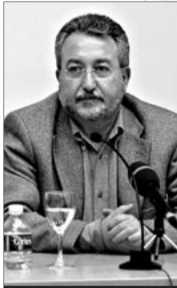
El científico Bernat Soria

es la única autonomía que tiene los deberes hechos, y esperamos que el resto de España los tenga en los próximos doce meses, una vez se resuelva el proceso legislativo para que todo esté conforme a derecho».