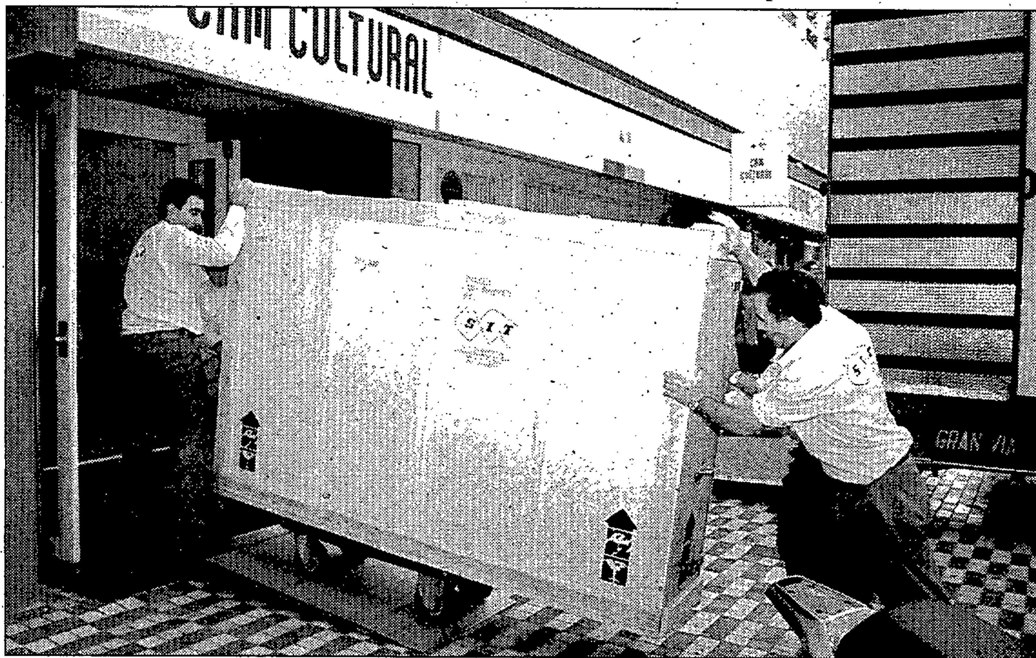
Las piezas llegaron ayer a Alicante en un camión procedente del Museo San Pío V de Valencia

Para la realización de esta exposición se han restaurado todas las piezas en una iniciativa conjunta entre el San Pío V y la CAM, de manera que se han re-