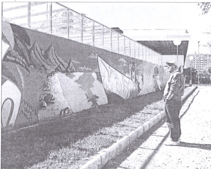
Un vecino de la zona admira la obra ejecutada este fin de semana por los alumnos de MurART.

Oído lo oído, no podemos más que recomendar la colección de lieder schubertianos que Goerne ha grabado para el sello Harmonia Mundi. Concretamente, la colección de Die Schöne Müllerin fue grabada el pasado año, con el acompañamiento de Christoph Eschenbach. También en 2009, Goerne obtuvo el premio de la crítica operística que conceden los Amics del Liceu por su participación en la Schubertiada de Vilabertran (Girona). Más allá de perfeccionismos técnicos, la voz de Goerne embruja por su brillante textura, lo que unido al hechizo melódico de Schubert es sinónimo de magnificencia lírica. ¿Qué decir más? Grata tranquilidad y cerrar los ojos, donde dejarse llevar por la belleza de la música nos permitió gozar de una página bellísima del romanticismo musical.