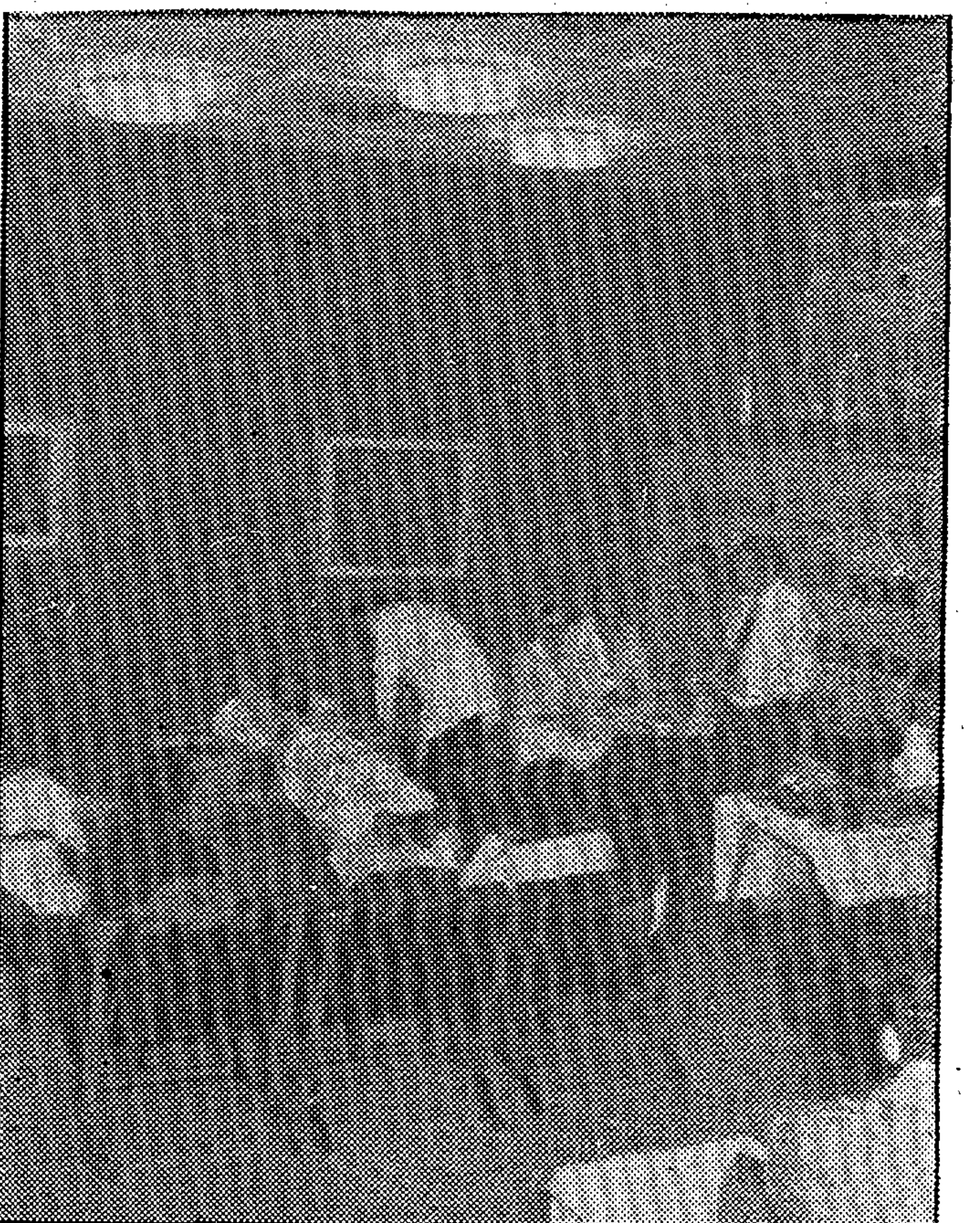
En el edificio de Mutua Unión Patronal, se procedió, ayer, por el equipo móvil de la Hermandad de Donantes de la Seguridad Social a la extracción de sangre a los asociados citados en dicho local y al personal de la entidad primeramente citada. En la foto, un momento del hecho

Por la Hermandad de Donantes de la Seguridad Social