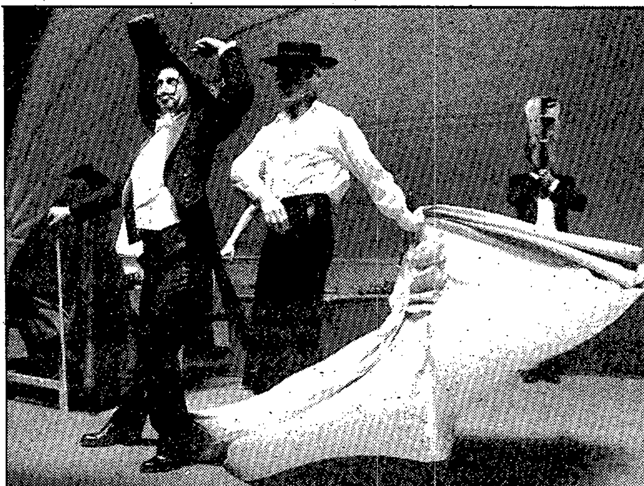
Un momento de la obra ayer estrenada en Alicante