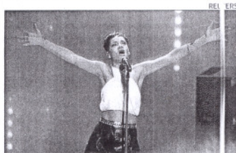
RIHANNA Cancela otro concierto sin dar explicación

► La cantante de Barbados ha cancelado el concierto que iba a ofrecer el lunes en Houston, en el que es ya la tercera cancelación de un concierto de su gira pero, a diferencia de otras ocasiones, esta vez no ha dado ninguna explicación. EUROPA PRESS