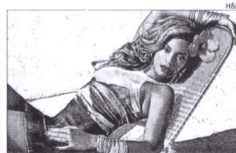
BEYONCÉ Inicia una campaña contra el hambre

► Una fotografía de Angelina Jolie junto a un caballo blanco y desnuda de cintura para arriba será subastada en la sala Christie's de Londres en mayo. Se trata de una foto de David LaChapelle que podría superar los 50.000 dólares.