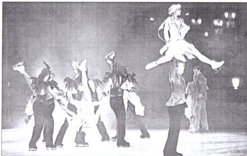
Una imagen del espectáculo de ballet sobre hielo, que se representará en el Teatro Principal.