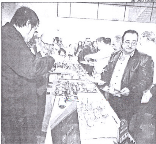
Presentación de la Quincena Tapas, ayer, en la Cámara de Comercio.

La primera quincena se celebró el pasado mes de junio, mientras que la segunda, que se prolongará hasta el 20 de noviembre, coincide con Lo Mejor de la Gastronomía que acogerá IFA entre los