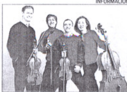
El Cuarteto Brentano.