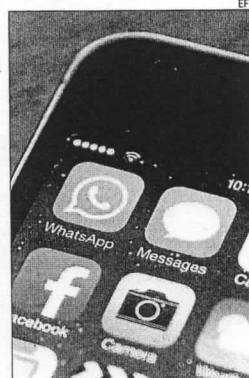
La aplicación WhatsApp.

WhatsApp tiene unos 450 millones de usuarios mensuales en activo, el 70 por ciento de ellos activos a diario. La popularidad del servicio se debe a que cada