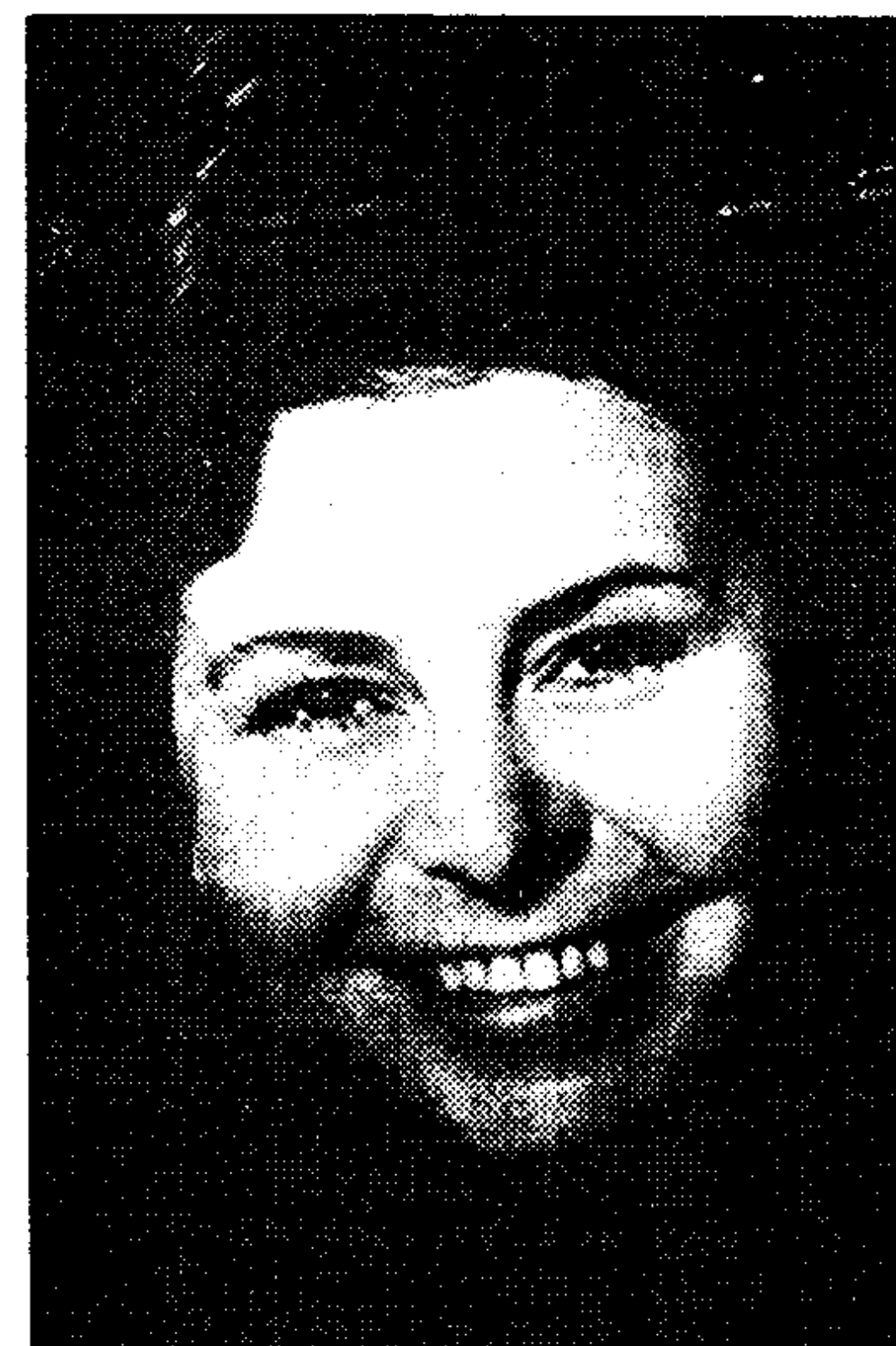
Le mezzosoprano Christa Ludwig

De su acompañante, el pianista español Edelmiro Arnal-