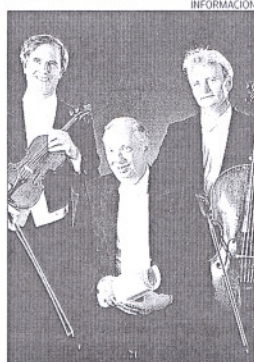
El Trío Guarneri Praga.

Durante los últimos años, Trío Guarneri Praga ha establecido el