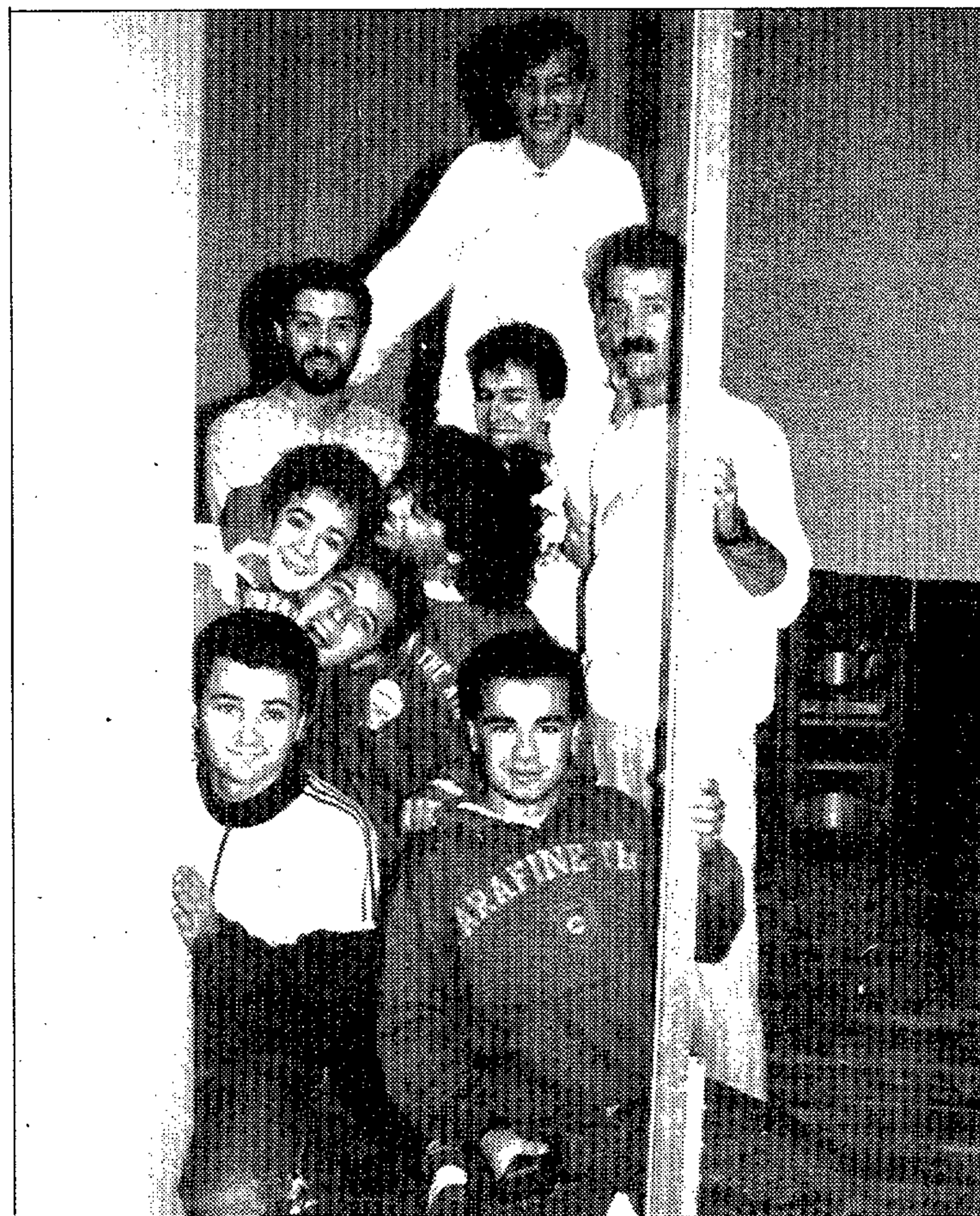
Parte del grupo «Jácara»

man para ir a Rentería al festival de Nuevas Tendencias Teatrales, sin embargo, y pese a que conseguimos premios y galar-