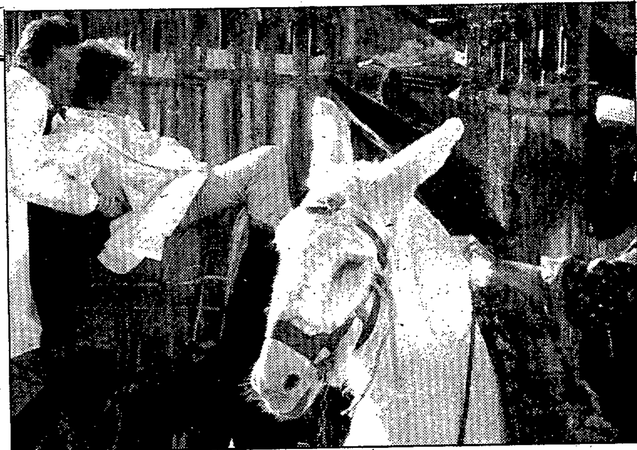
Medicina y tercermundismo definen esta endeble comedia

Cuando Hollywood sitúa una película de consumo, sin particulares ambiciones, en el Tercer Mundo hay que echarse a temblar. Lo suele hacer sin apenas elementos de juicio, sin un mínimo de rigor y profundidad y recurriendo a los tópicos de siempre. «Los matasanos» vuel-