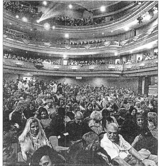
El Principal, con un lleno casi completo en The hole . JOSE NAVARRO

Por otro lado, EU «lamentó» que no se diera a conocer el avance de programación de la próxima temporada, «cuando en el orden