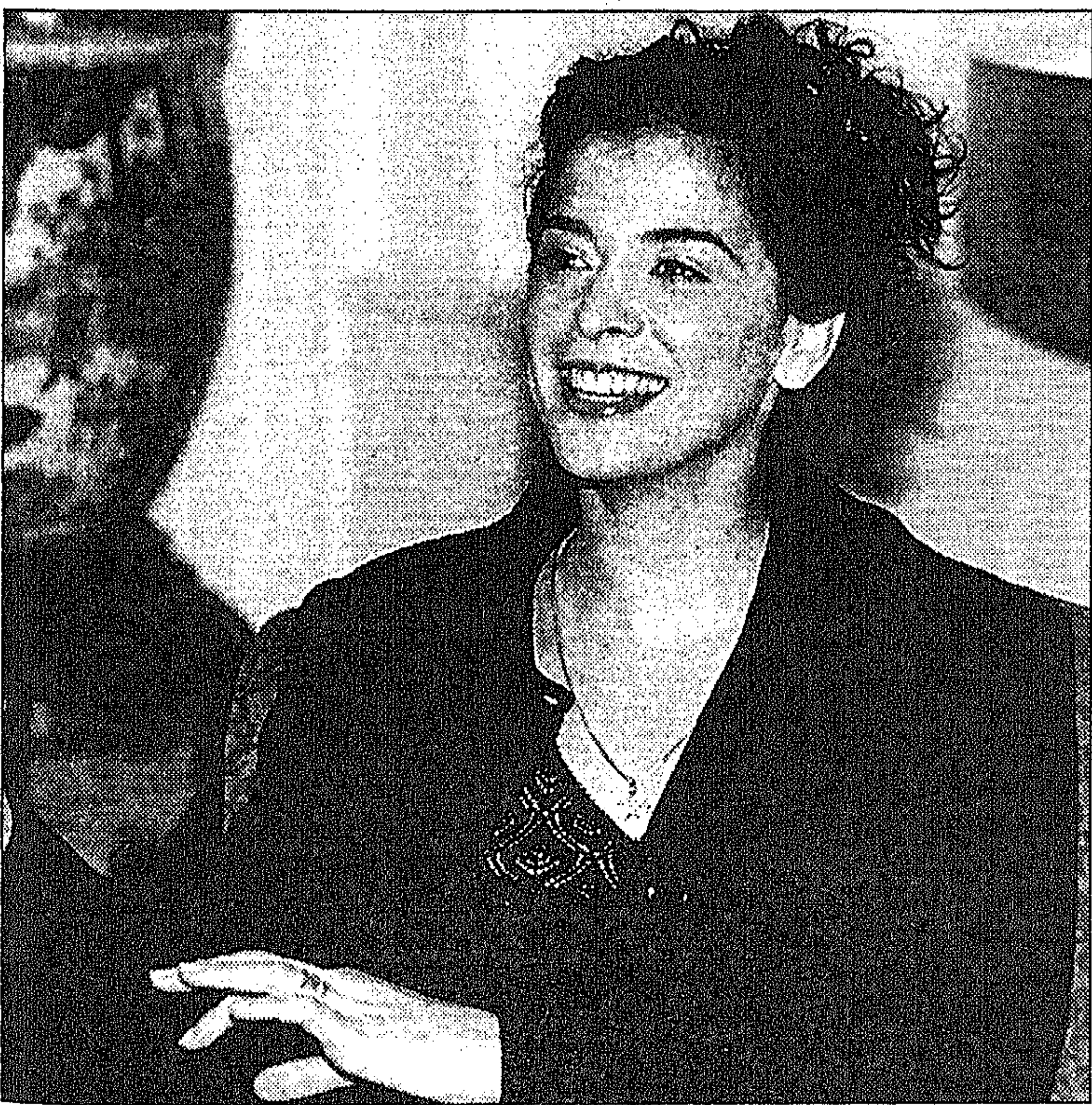
La actriz estadounidense Annabella Sciora, ayer en Madrid