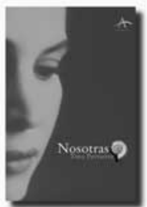
Nosotras Tino Perterra Una novela coral que aborda las preocupaciones y los desgarramientos sentimentales de las mujeres de hoy