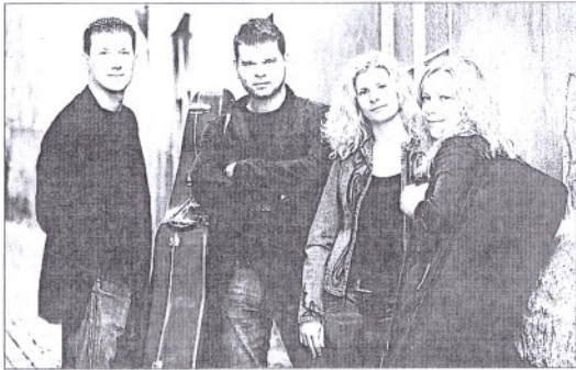
El Cuarteto Pavel Hass, de gran prestigio internacional. INFORMACIÓN