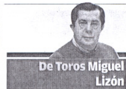
De Toros Miguel Lizón

CASI UNA NOVELA HISTÓRICA CON MUCHAS TEXTURAS, el galardonado Pablo Auladell (Premio Internacional de Álbum Infantil Ilustrado Ciudad de Alicante y Premio Autor Revelación en el Salón del Cómic de Barcelona) presentó el sábado en Fnac su nuevo álbum ilustrado «Rasmus y el vagabundo». Se trata de un volumen cuyas ilustraciones adaptan de forma magistral los textos de Astrid Lindgren, una de las autoras más importantes de literatura infantil europea.