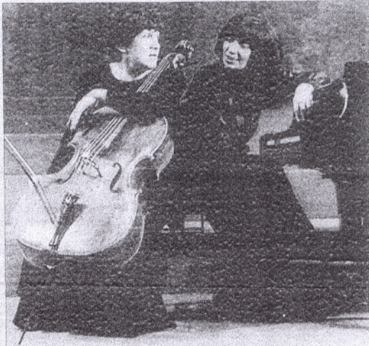
El violonchelista Mischa Maisky y el dúo formado por Natalia Gutmann y Elisso Virsaladze, dos de los platos fuertes del próximo curso en la Sociedad de Concursos. INFORMACIÓN