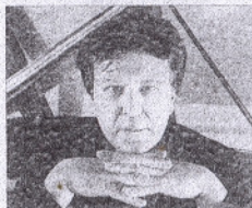
Andrei Gavrilov (piano) ► Jueves, 13 de octubre 2011