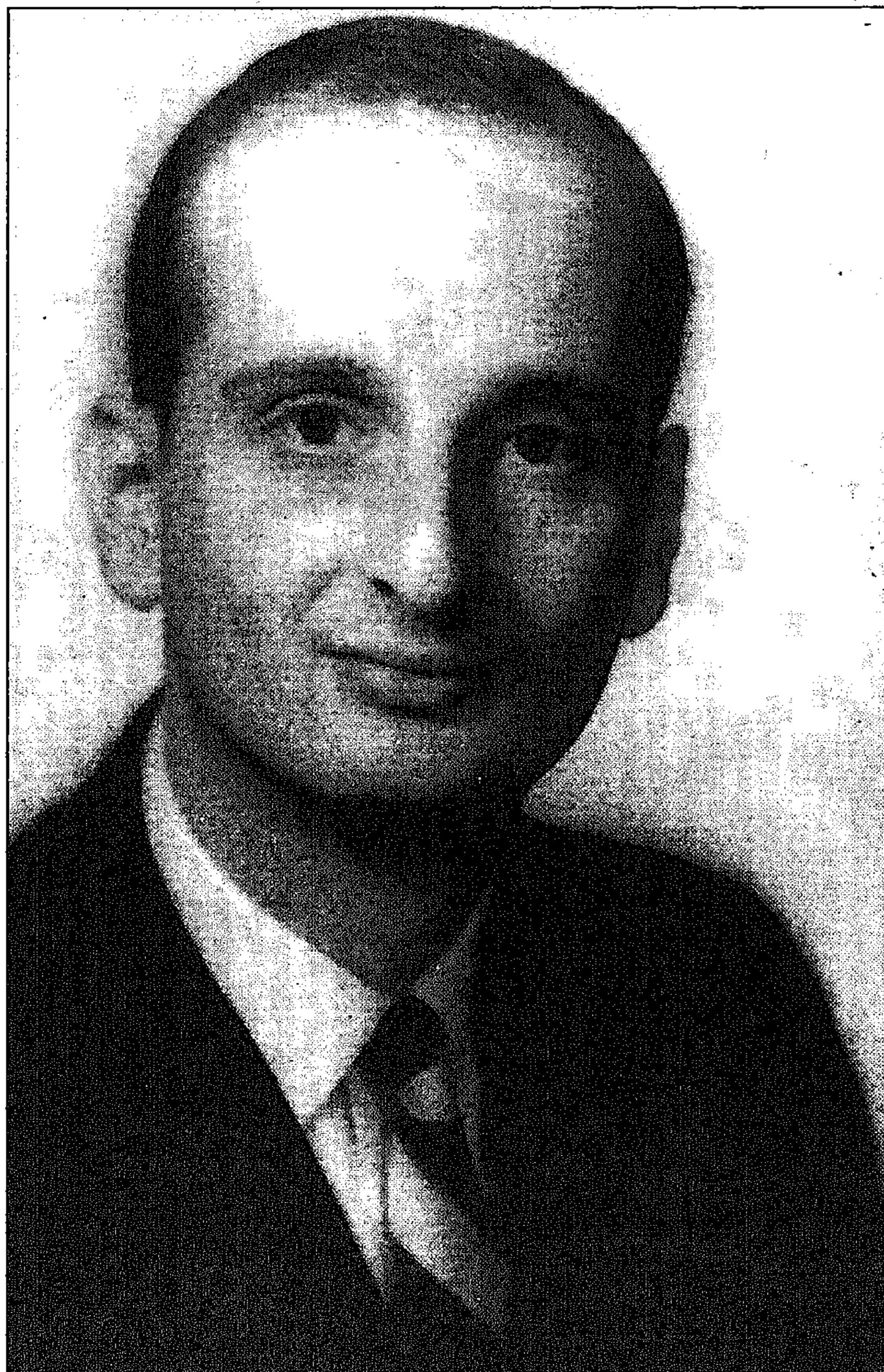
El científico Judah Folkman, en una imagen de archivo

El tratamiento con «endostatín» y «angiostatín» ha eliminado tumores de colon, próstata,