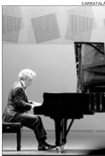
Zoltán Kocsis, durante el recital

En vez de varias piezas de Kurtag, programadas, Zoltán Kocsis tocó «Sonata n.º 21 en Si Bemol, Op. D 960», de Schubert, interpretada por Maria Joao el día 5, con objeto, según la Sociedad de Conciertos de Alicante, de comprobar cómo dos pianistas accen la misma obra. Cambio que