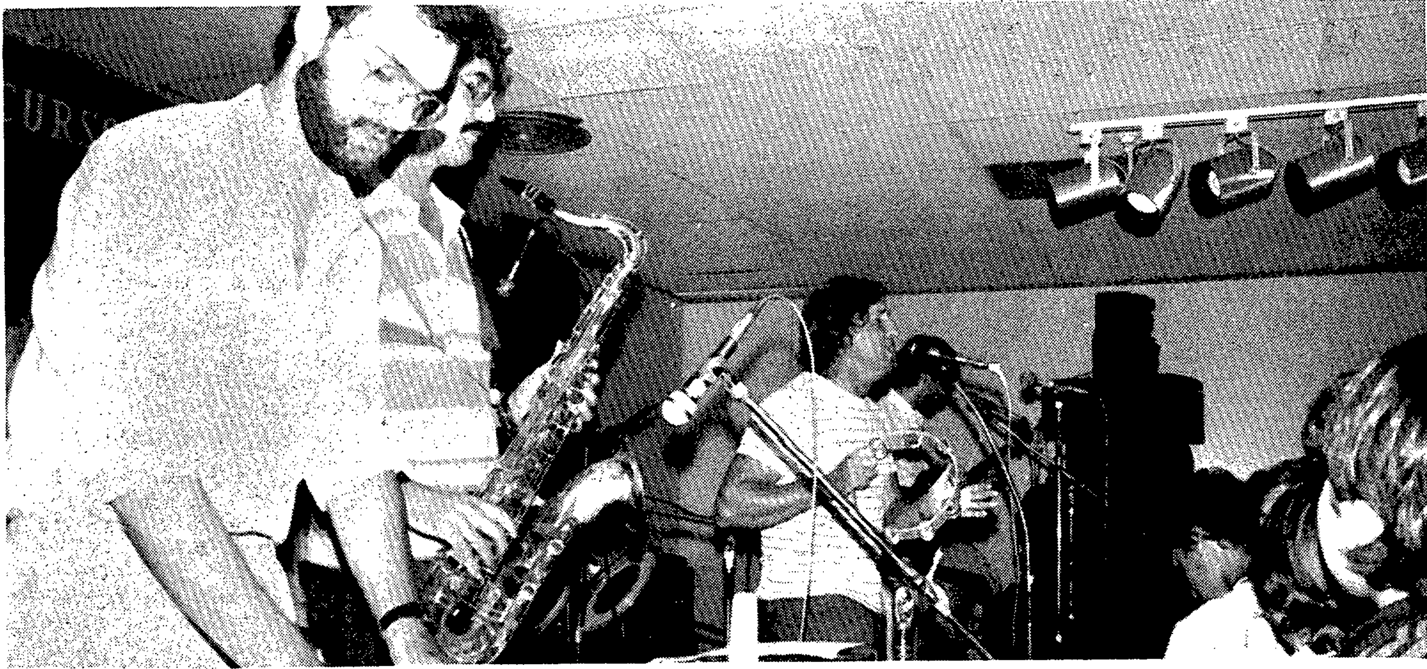
Para músicos noveles de la provincia