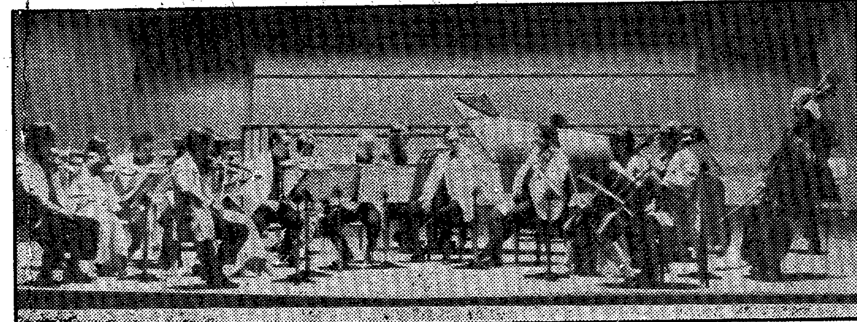
The Academy of St. Martin in the Fields

Es un programa de la Sociedad de Conciertos de Alicante