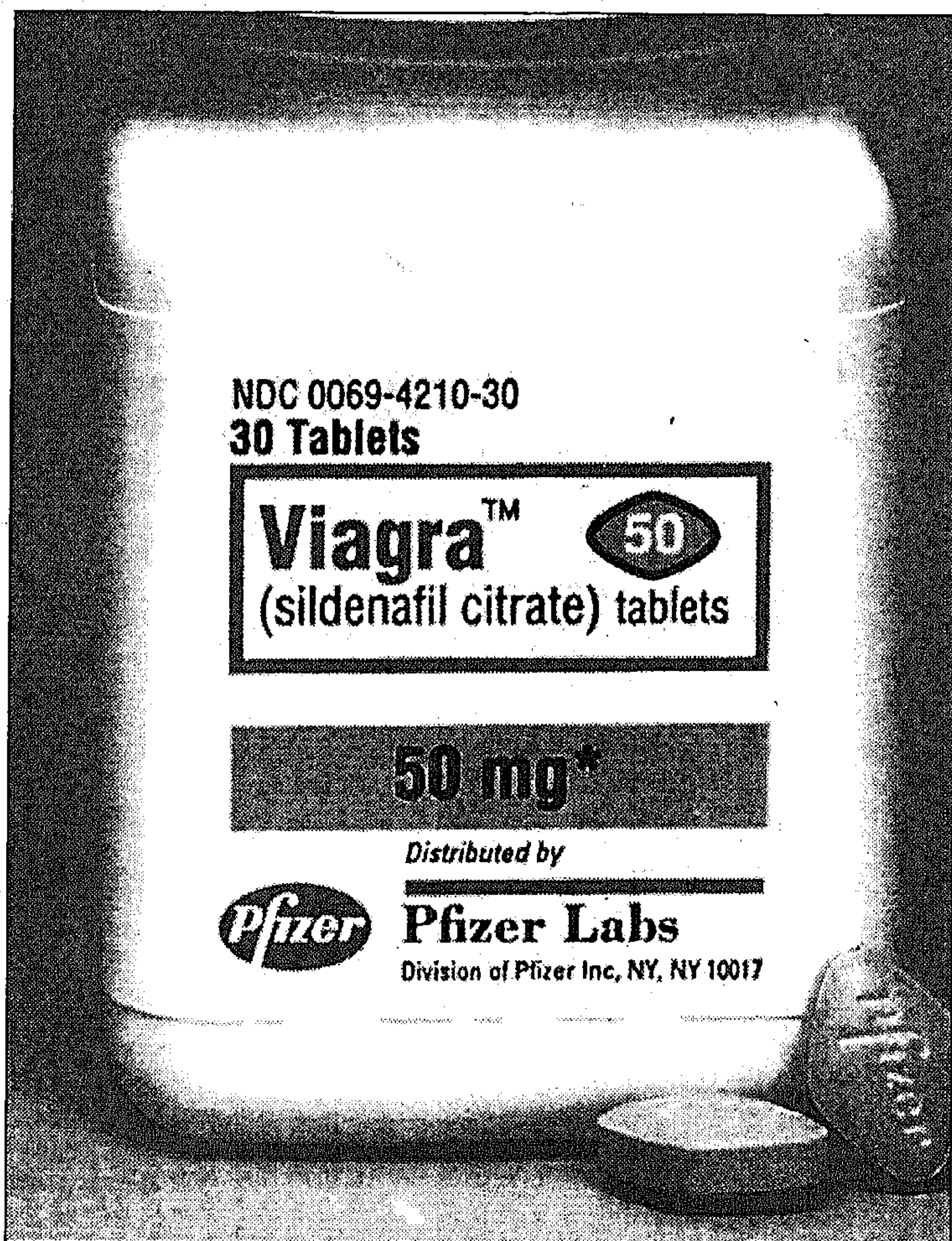
El fármaco «Viagra» es el último tratamiento contra la disfunción eréctil

La compañía recuerda que el sildenafil -el medicamento que