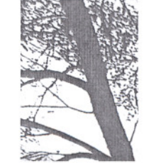
Calle Ramón y Cajal, s/n. Orihuela. T 965 300 638.

Museo de la Muralla. Calle del Río, s/n. Edificio Casa del Paso, campus de