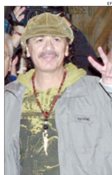
Santana, ayer en Barcelona

Sin embargo, esta evolución no puede hacerse en cualquier momento. El FNUAP advierte de que la «ventana de oportunidad» ahora está abierta pero se cerrará al cabo de una generación, a medida que las poblaciones vayan envejeciendo. Por eso es tan importante que las políticas sanitarias, educativas o legales se reformen «durante el próximo decenio» para que no se cumplan las últimas estimaciones demográficas: que la población de los países pobres se triplicará en 50 años.