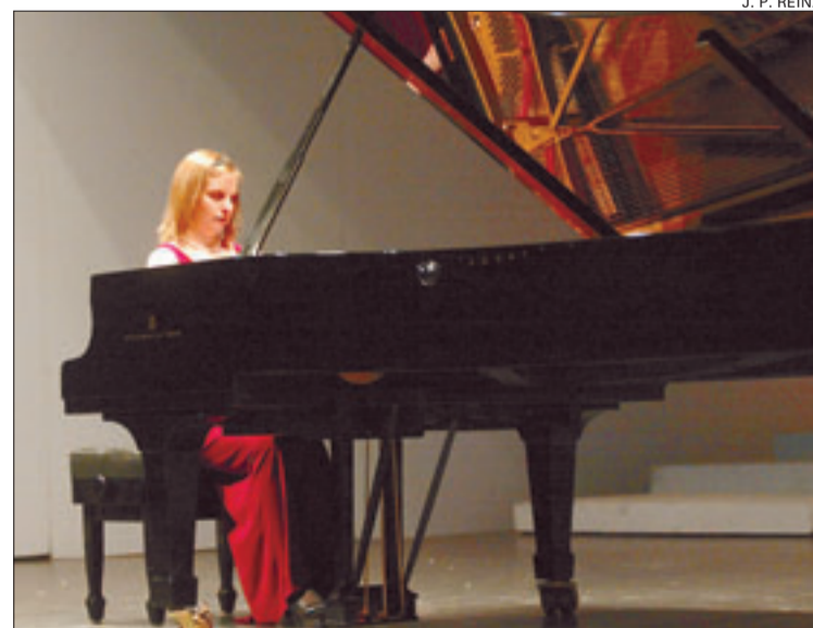
Un momento del recital de Orli Shaham en el Teatro Principal el lunes

Orli Shaham lleva las partituras dentro y a medida que acaricia el piano con agilidad o lo toca con el impulso de quien lleva la música en su interior, el instrumento canta, grita y nos lanza los sentimientos musicales que ella le transmite. En este sentido, otro ejemplo lo tenemos en las «Piezas para piano, op. 118», del alemán Brahms, quien tiene en la romanza su parte más tierna y jugosa. De contenida pasión, fusiona los estilos clásico y romántico, y el estado puro de su música rompe las barreras del tiempo. La sensibilidad y la entrega de Shaham en los