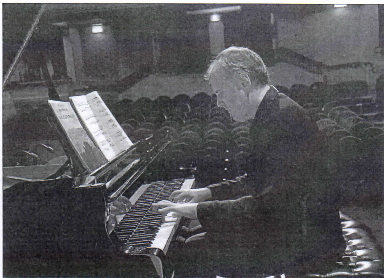
El pianista norteamericano Nicholas Angelich. INFORMACIÓN

▶ El músico norteamericano interpreta hoy obras de Beethoven y Mussorgsky en el Principal de Alicante