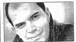
El pianista ruso Kirill Gerstein.