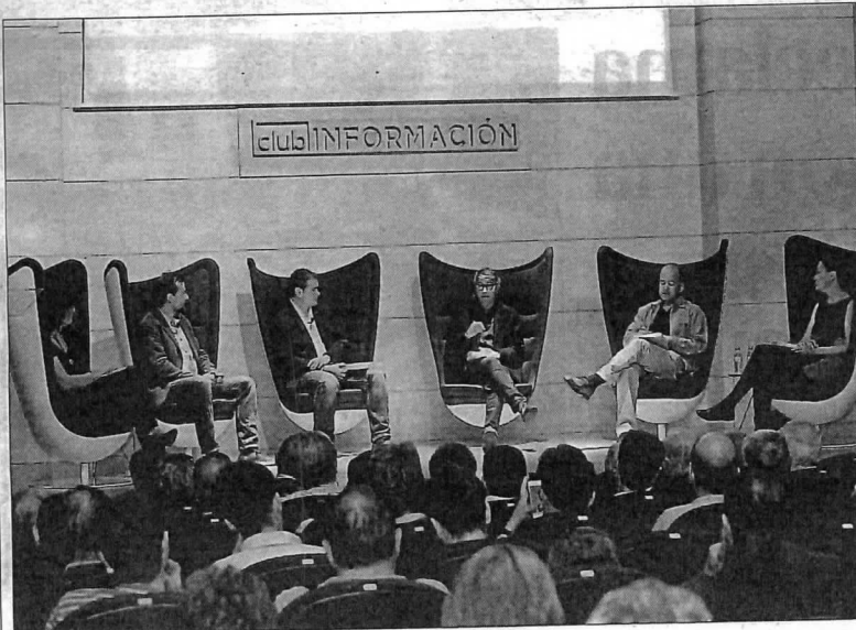
Un momento de la presentación de «CrystalZoo. Brillantes animales salvajes». PILAR CORTÉS