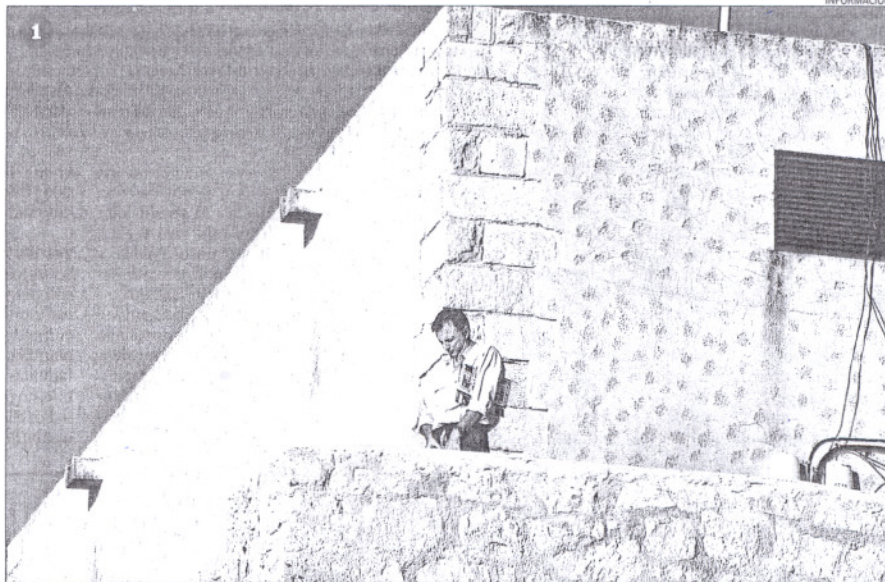
Una persona orinando ayer desde un punto visible de la muralla del castillo de Santa Bárbara.