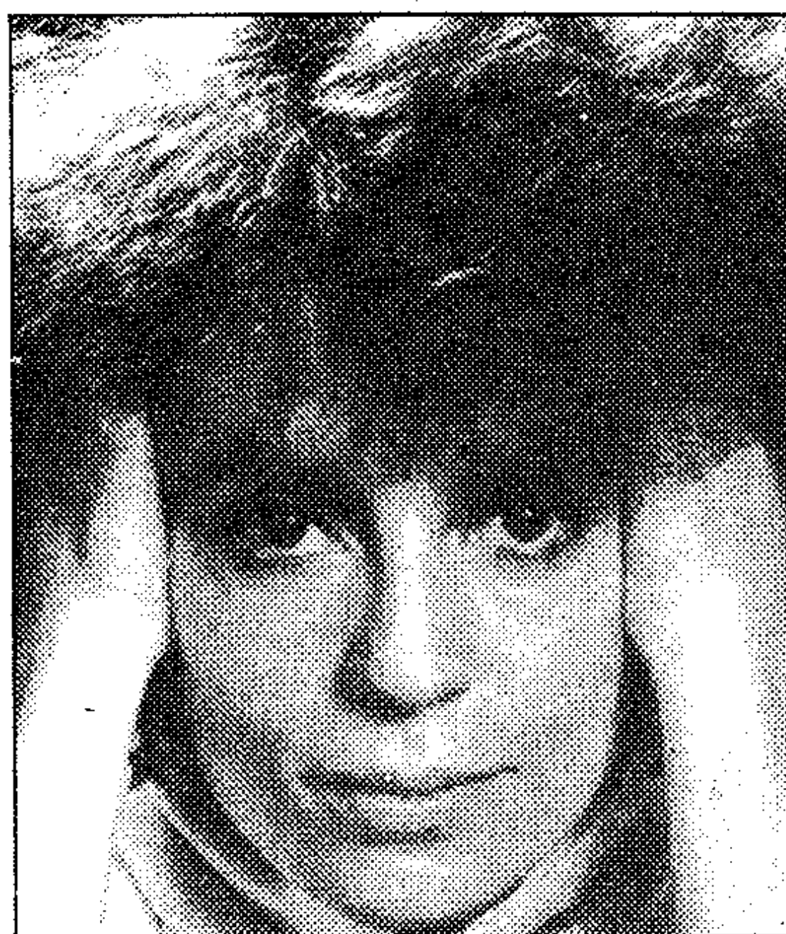
La pianista María Joao Pires vuelve hoy al Principal con otro esperado recital