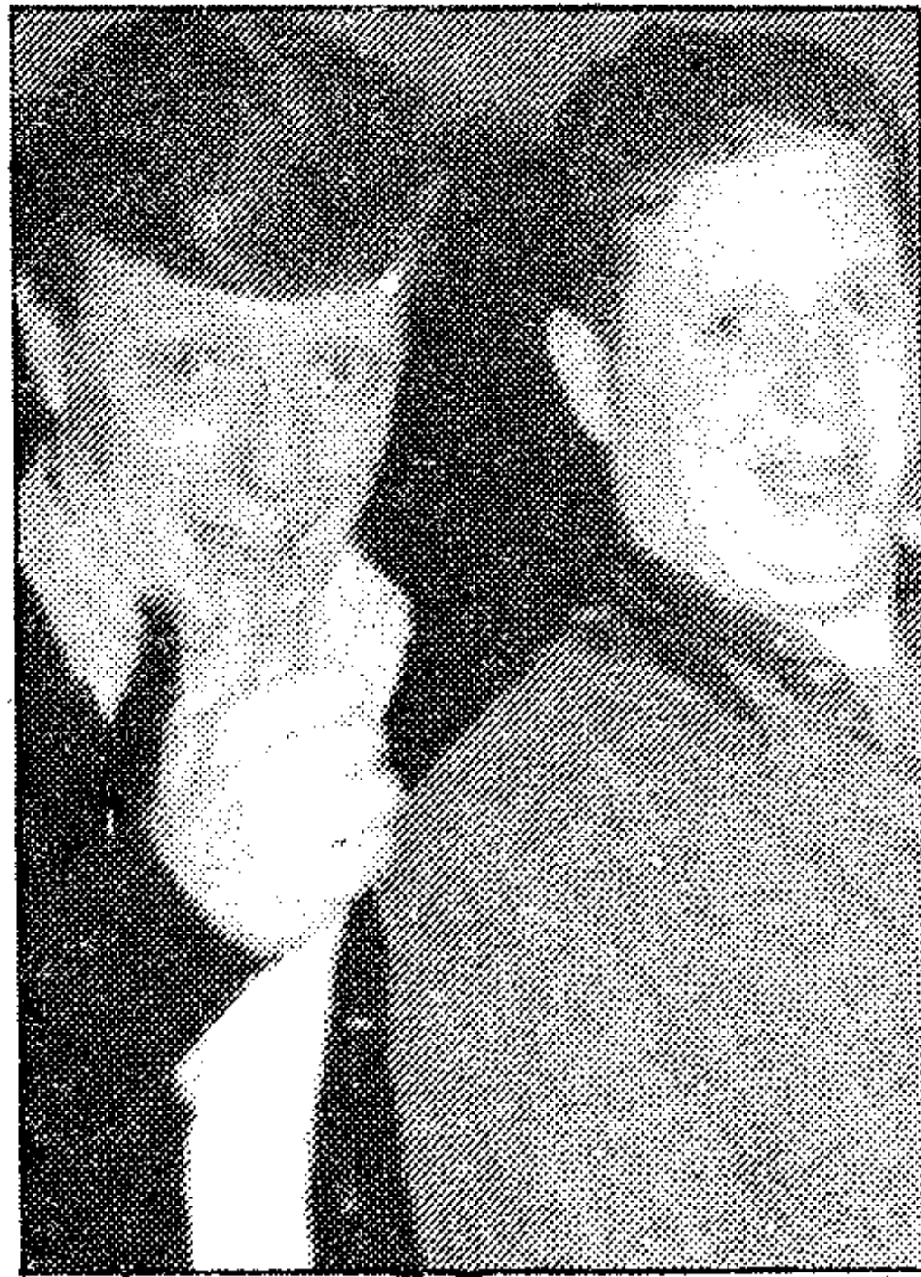
Una pareja que entra en el espectáculo con fuerza

Entre sus números más aplaudidos figura «el de los americanos» y una parodia que hacen sobre el anterior programa televisivo de «La tarde». Su show es una carcajada continua.