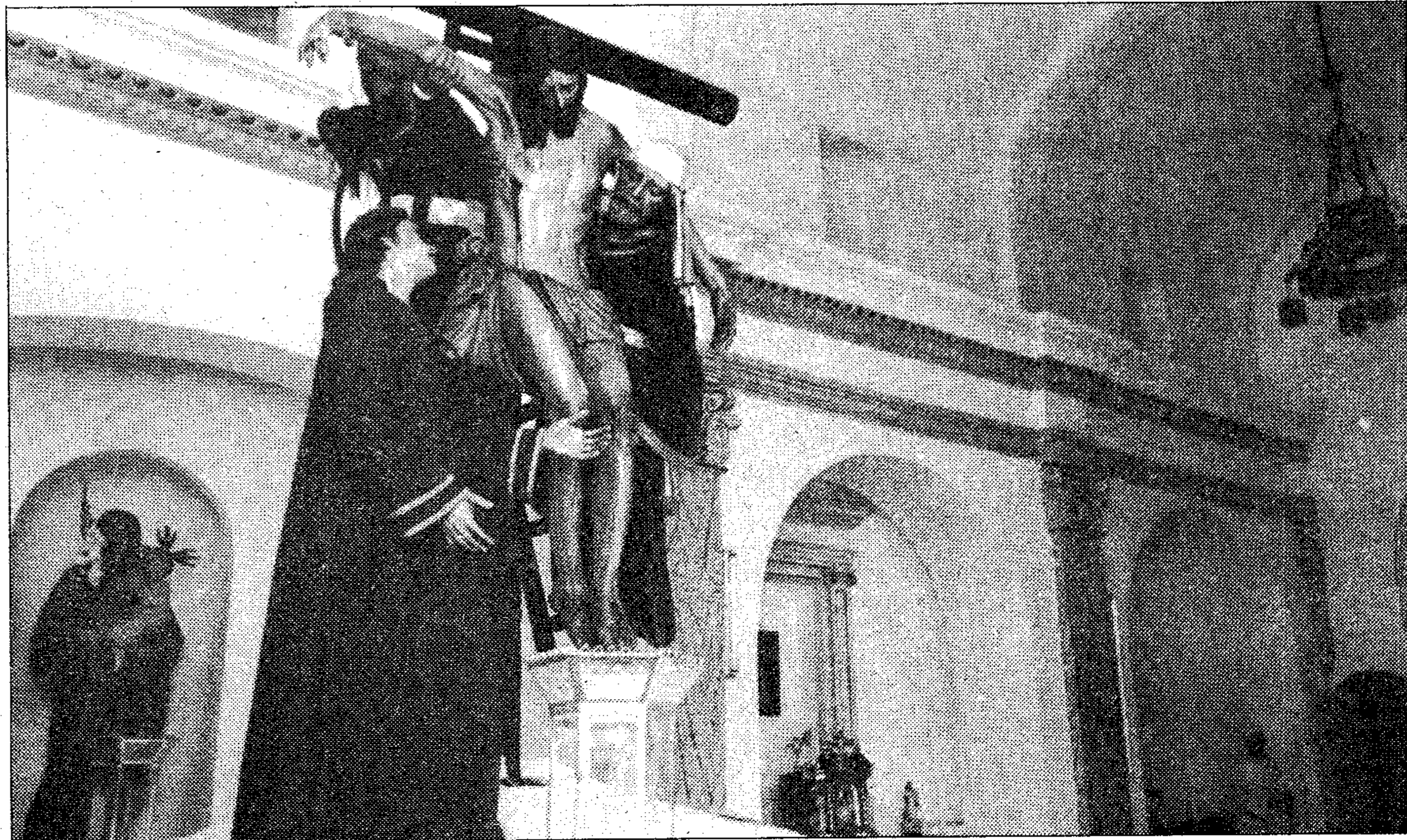
«El crucificado» y «El descendimiento», dos de los pasos con más solera