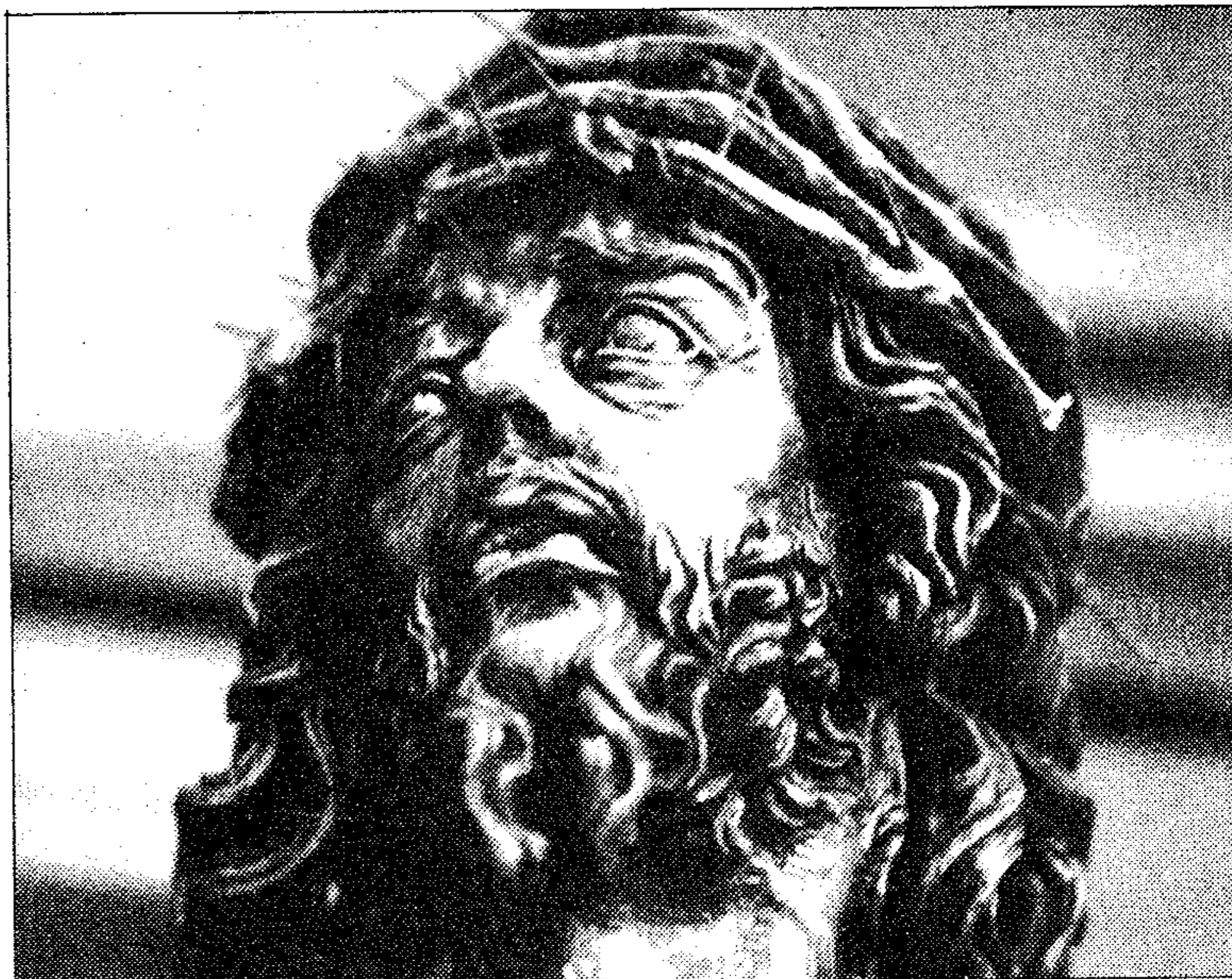
El «Cristo gitano»

Esta cofradía gozaba del privilegio de redimir a un preso, en la noche del Miércoles Santo, merced a una petición formulada por sus miembros, en su mayor parte