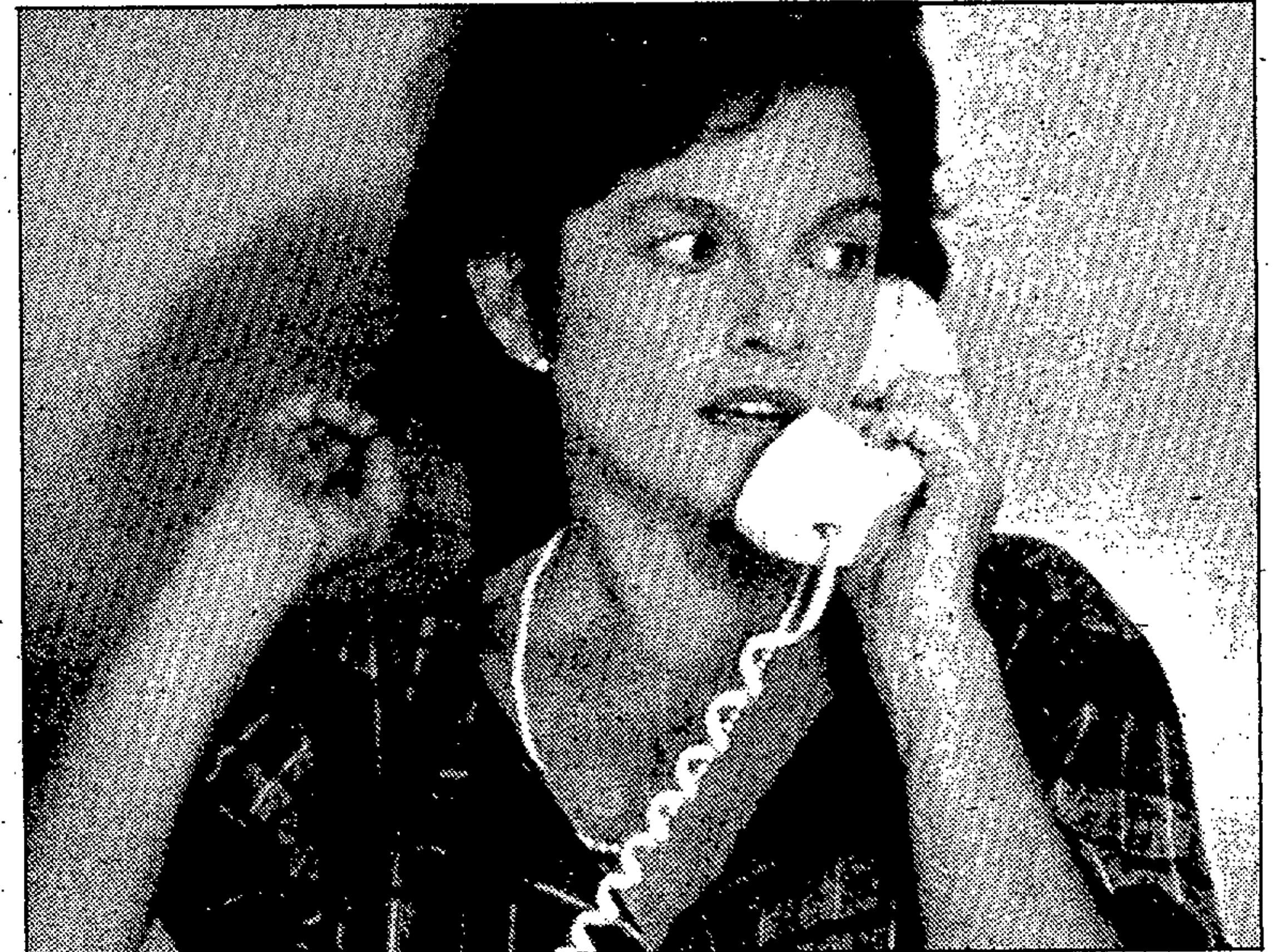
Genevieve Bujold es la protagonista de esta singular cinta