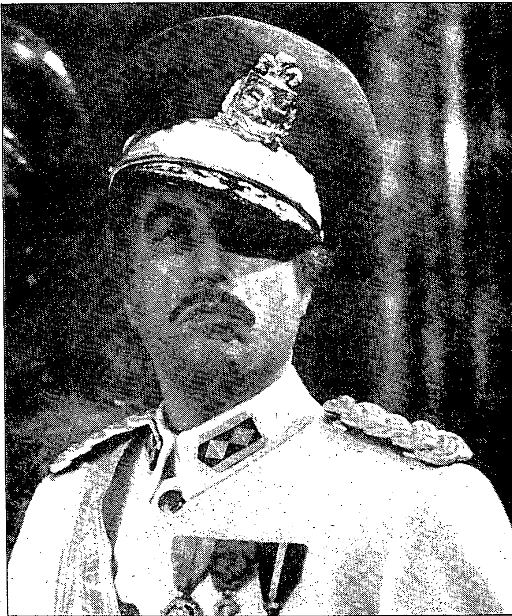
Richard Dreyfuss hace una gran creación en el papel de actor-dictador

Es un argumento que en otras manos podría haber servido para urdir una sátira o una astracanada de dudosa comici-