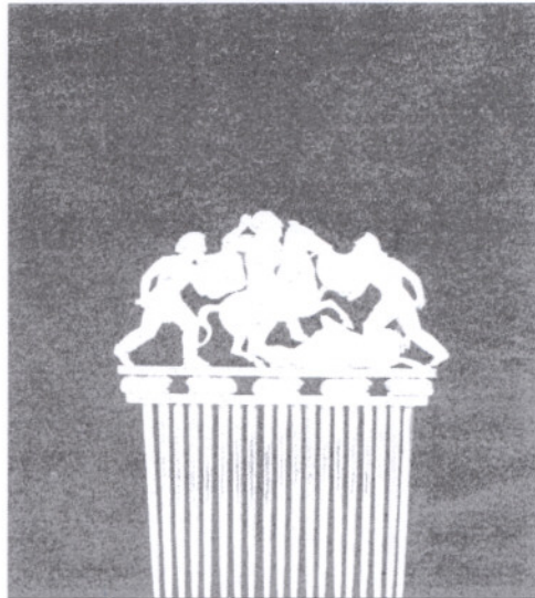
Dos de las piezas arqueológicas de oro procedentes del Ermitage de San Petersburgo que se exhibirán desde abril en el Marq.