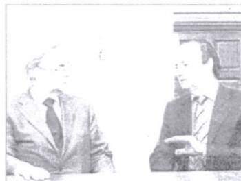
Ripoll y el vicedirector del Ermitage.

nología del colosal país que separa Europa de Asia: una sala se dedicará a la prehistoria, otra al imperio escita y la colonización grecorromana y la última abordará el desarrollo de