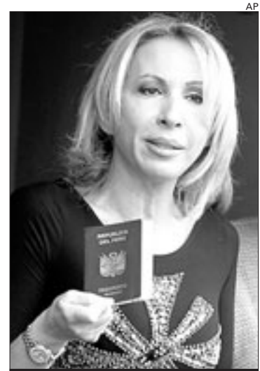
La presentadora Laura Bozzo

La presentadora televisiva Laura Bozzo, una de las más populares de la cadena hispana en Estados Unidos «Telemundo», se encuentra arrestada en Perú acusada de haber recibido 3 millones de dólares del ex jefe del espionaje peruano Vladimiro Montesinos durante el gobierno de Fujimori. Bozzo ofreció su sueldo en Telemundo —que cifró en 2 millones de dólares— y su pasaporte como garan-