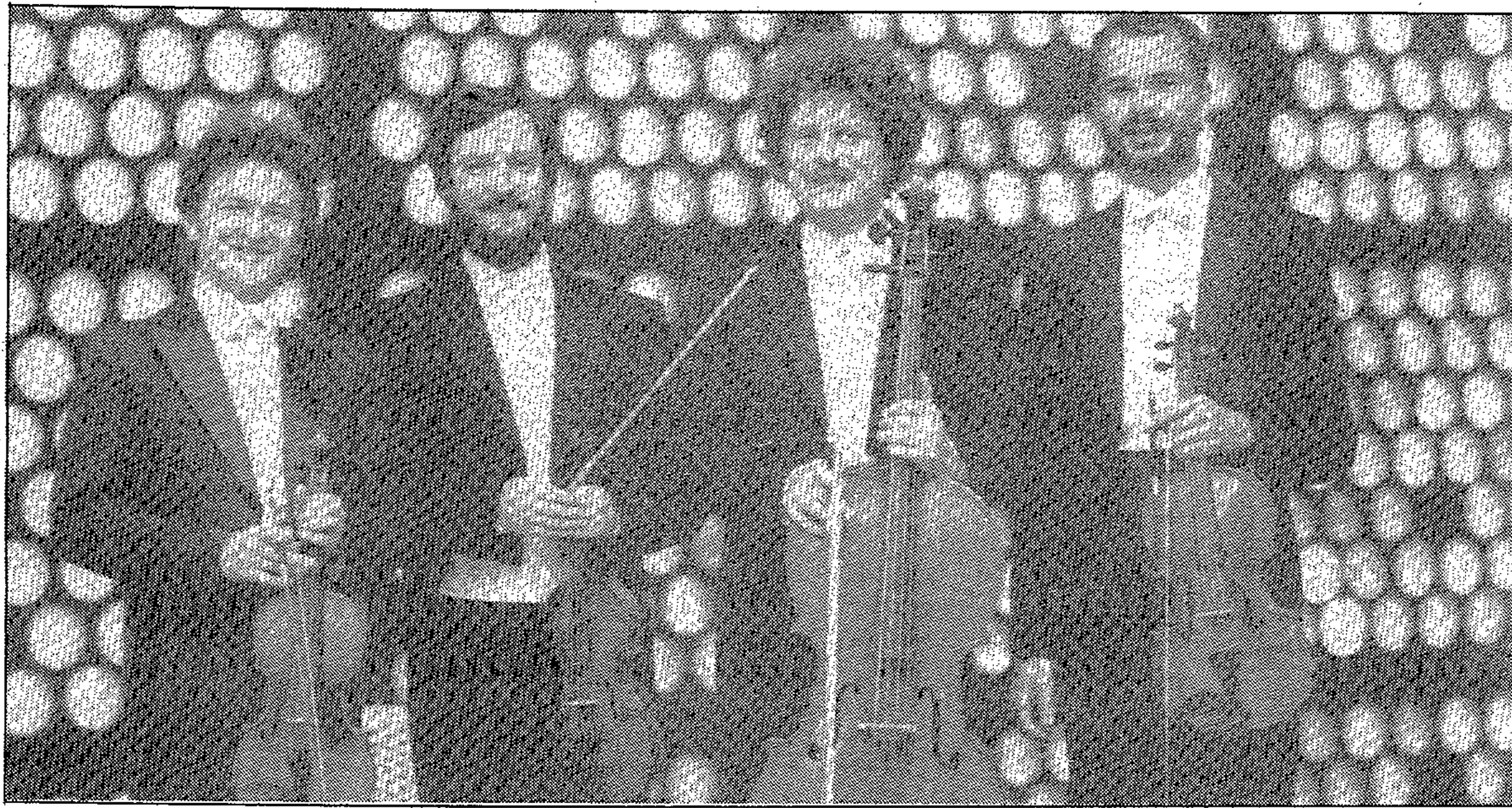
Cuarteto de la Filarmónica de Berlín

El concierto del domingo constituye una buena posibilidad de comprobar la excepcional calidad de los componentes de la orquesta. El cuarteto de la Filarmónica de Berlín fue fundado a principios de los ochenta por cuatro primeros pupitres de las cuerdas, con el deseo de encontrar paralelamente a su actividad como músicos de orquesta un medio de expresión más íntimo. El éxito que obtuvo esta colaboración desde el primer momento no ha dejado de acrecentarse y el cuarteto figura desde hace años en todos los grandes festivales del mundo incluido Salzburgo.