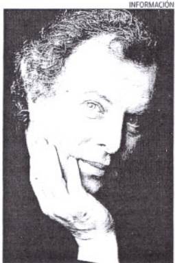
El pianista Andrés Schiff.

Schiff ha actuado en los mejores teatros del mundo y ha sido ga-