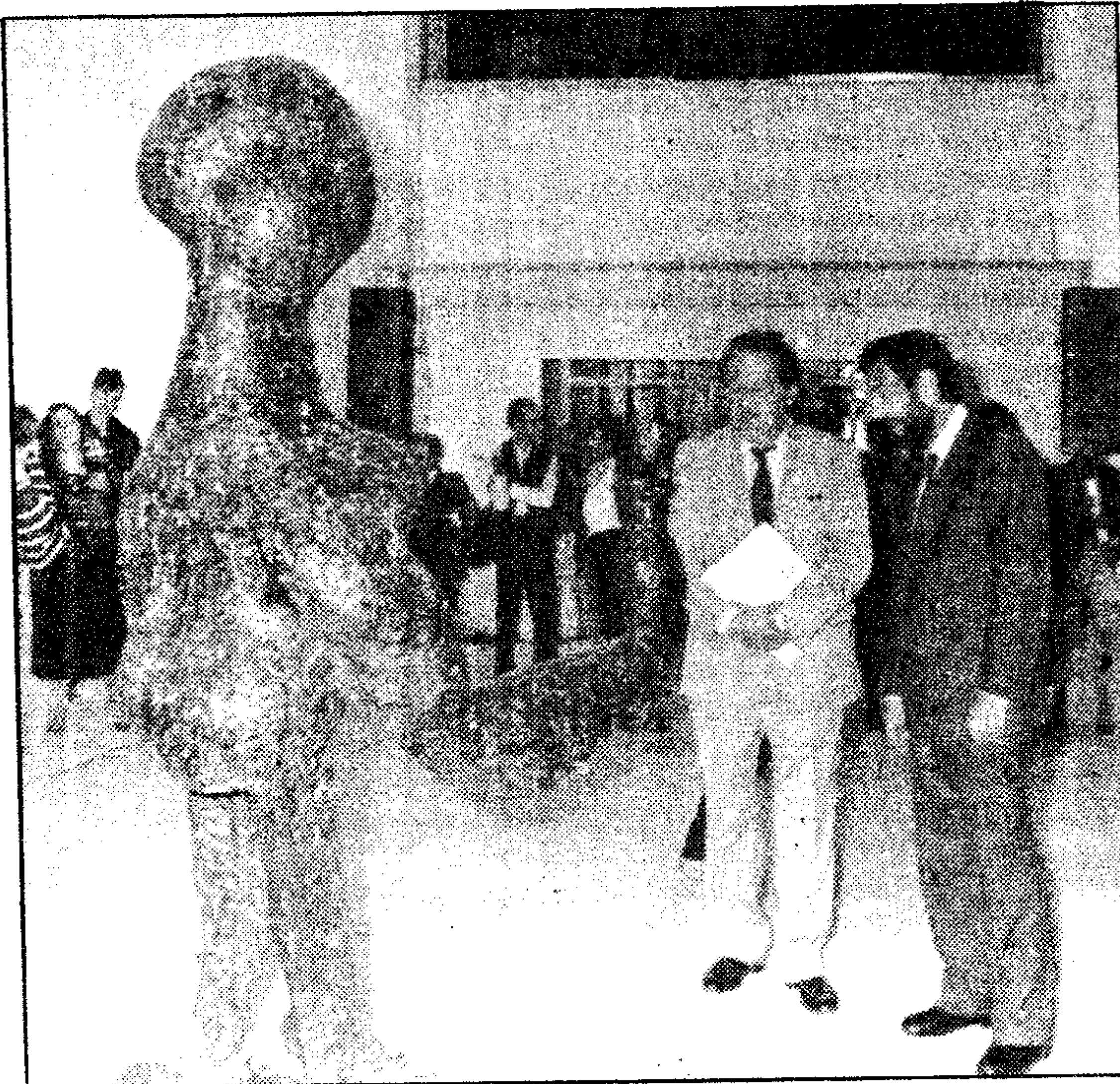
La escultura de Picasso, «La mujer oferente», que ayer fue presentada en el palacio de Velázquez, en Madrid. Ministro de Cultura y director de Bellas Artes la contemplan