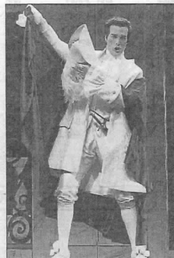
Imagen de la ópera.

► La obra, de Mozart, se representa mañana en Alicante y en dos actos por la Compañía Lírica